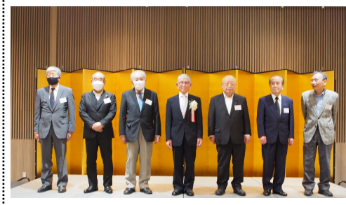
【懇親会において】伏木会計、長田監事は所用のため欠席