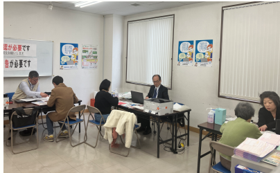
【会館2F 相談会場の様子】

最後に、相談時に来年の確定申告期の指導日をご予約いただいた皆様には、12月末頃にハガキでご案内いたします。予約されなかった方や指導を受けられなかった方は、希望日を事務局までお知らせください。